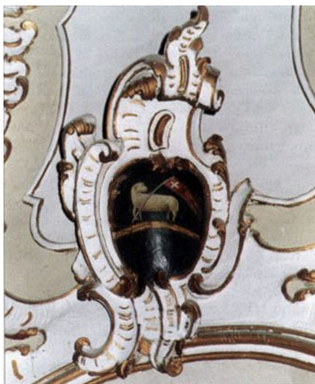
Siracusa, chiesa dell'Immacolata - Stemma dei Daniele.

Il ponte di S. Alfano, costruito nel 1796 per collegare l'omonimo feudo con la "terra" di Canicattini.