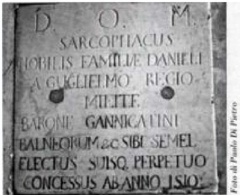
Lapide sepolcrale attestante la concessione di sepoltura per i Daniele, nella chiesa dell'Immacolata di Siracusa.

Siracusa, chiesa dell'Immacolata - Stemma dei Daniele.