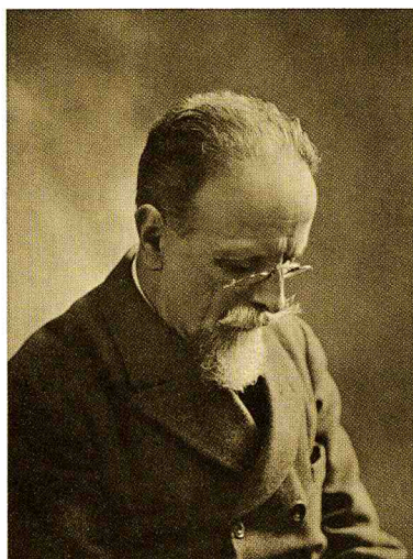
1. Paolo Orsi (1859-1935) (da Paolo Orsi 1935).

Però nelle stesse lettere Orsi mostra di non farsi illusioni, cosciente che le carenze sono di fatto congenite all’amministrazione e che per questo motivo resteranno irrisolvibili a lungo. Non può destare meraviglia, allora, che per adempiere ai compiti del suo ufficio di soprintendente egli si rivolgesse anche ai privati, naturalmente ai più illuminati e ai più sensibili alla cau-