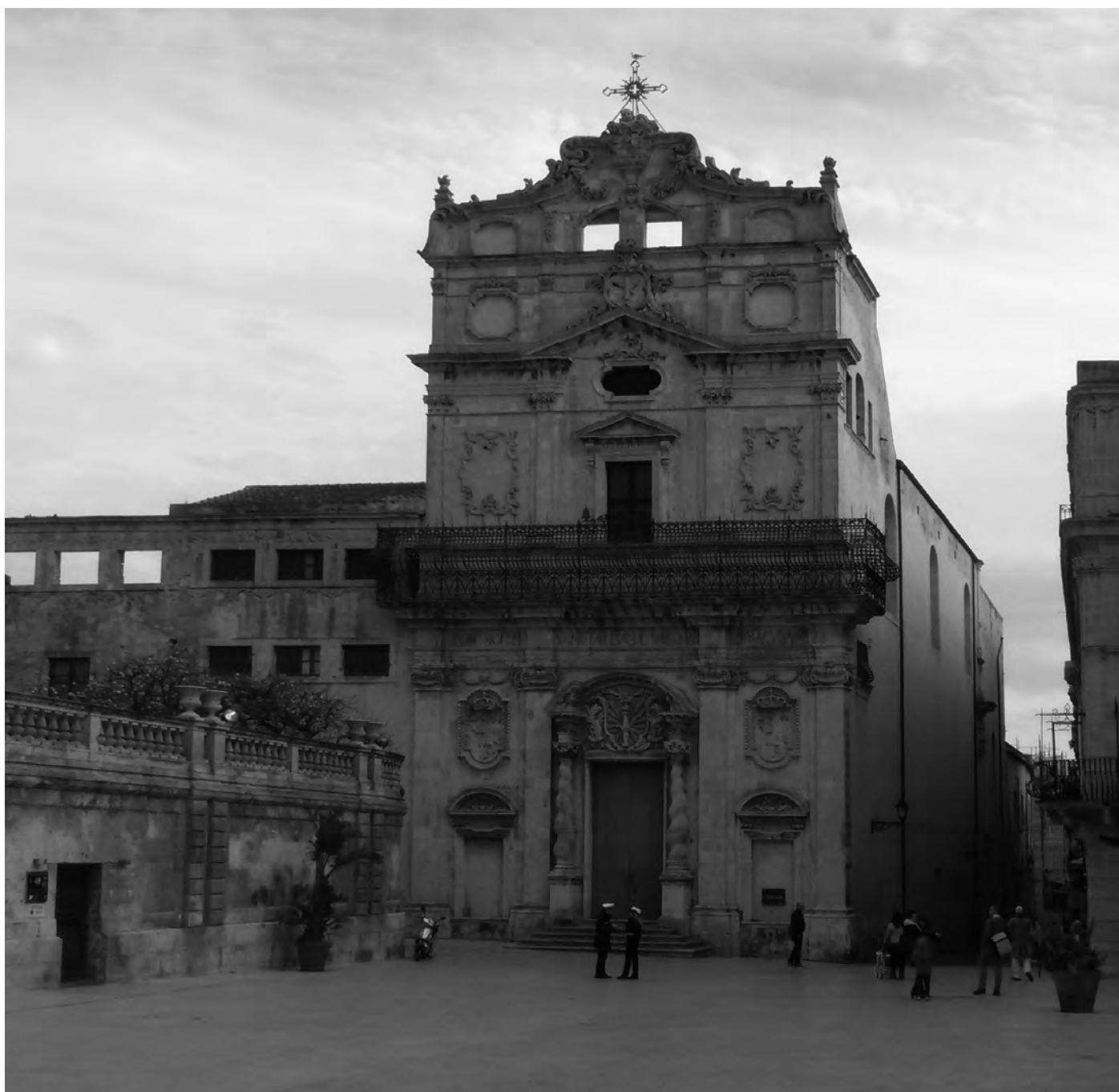
Fig. 1. Siracusa. Chiesa di Santa Lucia alla Badia.

cendo come unico decoro il sottodavanzale a volute. Nella seconda metà del Settecento, il vescovo Requesens diede impulso all'edilizia religiosa di Siracusa. Verosimilmente, questi interventi in piazza Duomo dovettero aver generato anche la necessità di "riformare" la fabbrica di Santa Lucia. Dopo la morte dell'architetto-sacerdote Pompeo Picherali (1746 ca.), gli ingegneri militari Dumontier e Nicolò Sapia (†1792) si affermarono come principali "referenti" nell'ambiente ecclesiastico. Per la chiesa di Santa Lucia,