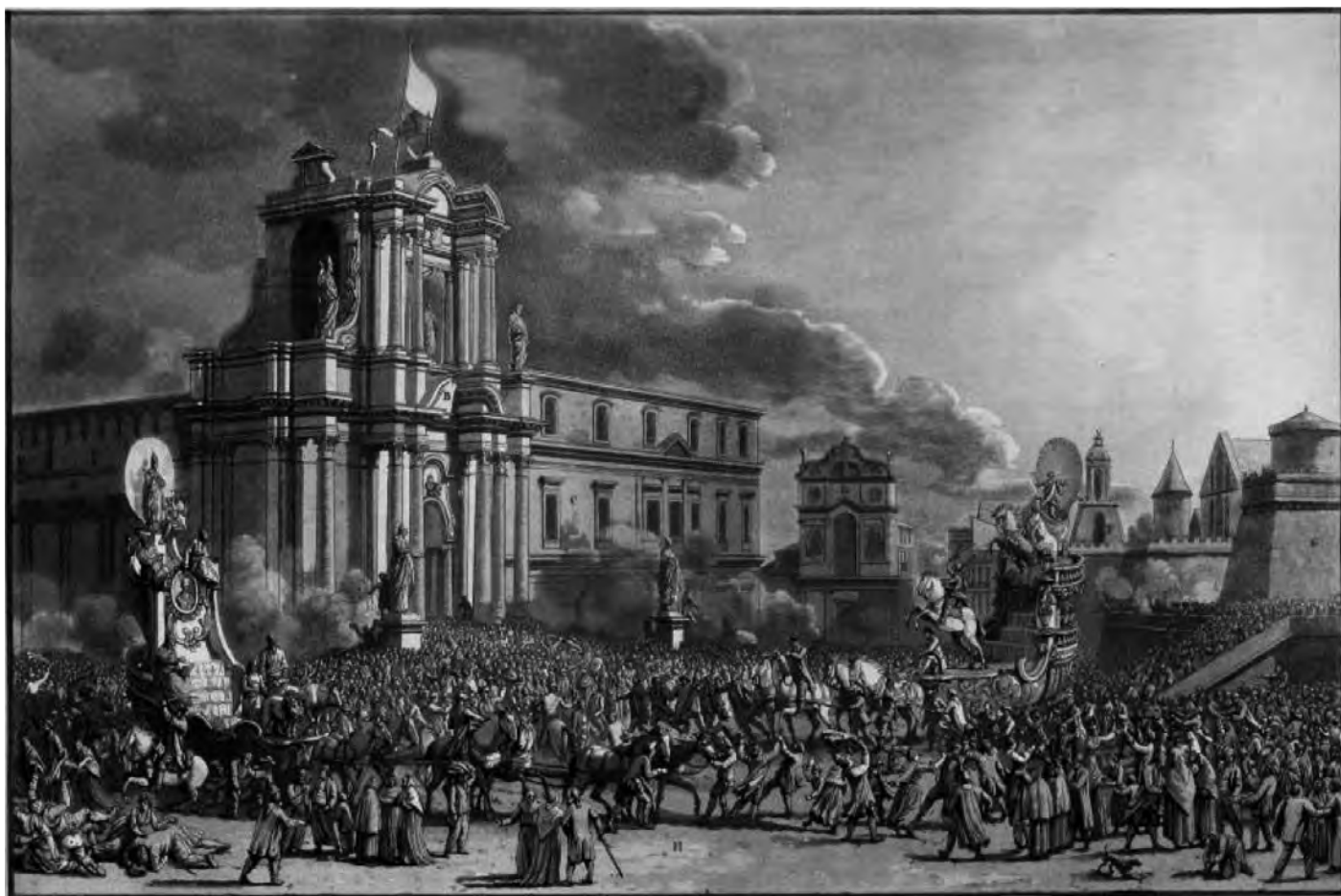
Fig. 7. J. Houel. Chars des Confreries du St. Esprit et de St. Philippe (da J. Houel, Voyage pittoresque des Isles de Sicile, Malthe et Lipari, Paris 1782-87, II).

La chiesa ristorata fu infine inaugurata alla presenza del Vescovo Alagona il 18 aprile 1784, come riporta sia l'annalista Giuseppe Maria Capodiceci 64 , che l'iscrizione posta all'interno dell'aula 65 .