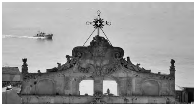
Fig. 6. Siracusa. Chiesa di Santa Lucia alla Badia, particolare del coronamento.

Cardona (1730-1820), membro della mastra nobile di Siracusa, e il sacerdote Sebastiano Vella incaricarono, il 6 maggio 1782, Benedetto Bonajuto di demolire le vecchie cappelle e di realizzare gli apparati in stucco 62 . Gli affreschi sul «quadrone grande nel tetto della chiesa», raffiguranti il miracolo di Santa Lucia furono affidati al senese Marcello Vieri 63