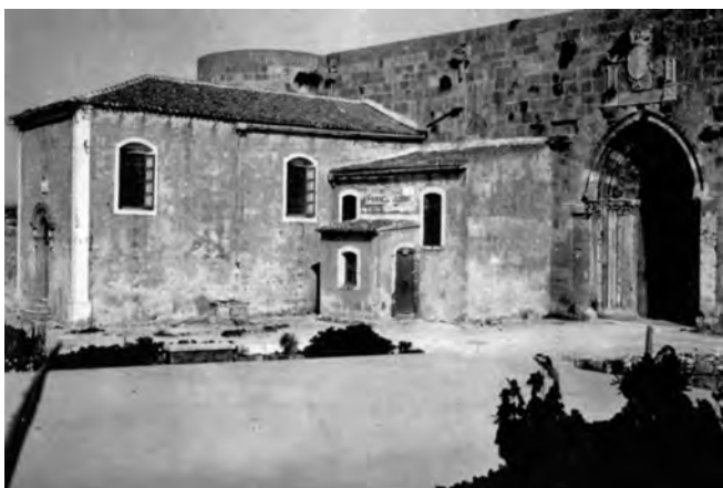
Fig. 4. Siracusa. Chiesa di San Giacomo al Castello, 1761 (da G. Agnello, L’architettura sveva in Sicilia , Roma 1935, p. 49).