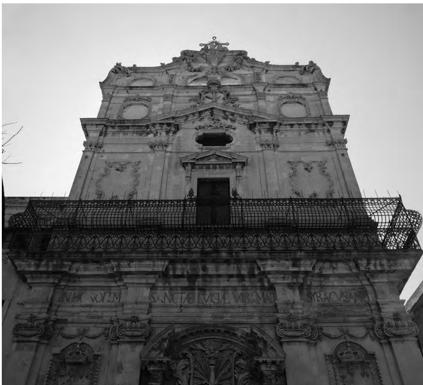
Fig. 5. Siracusa. Chiesa di Santa Lucia alla Badia, particolare del prospetto.

Tuttavia i lavori non erano ultimati e infatti un altro cantiere interessò l'aula della chiesa tra il 1782 e il 1783. I nuovi procuratori del monastero, Francesco