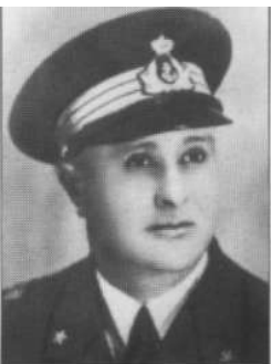
ANGELINO Francesco da Siracusa Nocchiere di Porto Medaglia d'Oro al V.M. «Con sublime spirito di sacrificio e con sommo disprezzo di ogni pericolo, si offriva volontario per formare l'equipaggio di un motoscafo destinato a forzare il porto di Pola. Con ammirevole freddezza coadiuvava il suo comandante nel forzamento della base nemica. Fulgido esempio di virtù militari e di devozione al dovere» Pola, notte sul 14 maggio 1918