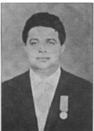
BRIGANTI Luigi da Lentini

Sottotenente di Fanteria Medaglia d'Oro al V.M. (alla memoria) «Comandante di posto di blocco costiero, benché circondato per varie ore da proponderanti nuclei di paracadutisti ed attaccato dopo da colonne nemiche, fedele alla consegna di resistere fino all'ultimo, combattè strenuamente senza lasciarsi sgomentare dalle gravi perdite subite dal suo plotone, infliggendone assai gravi al nemico finché più volte colpito mortalmente, cade al grido di Viva l'Italia immolando la sua giovane vita» Sicilia, luglio 1943