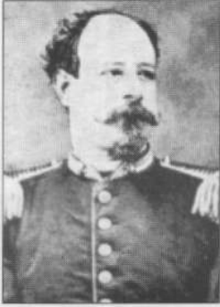
STATELLA Vincenzo da Spaccaforno (oggi Ispica) Tenente Colonnello II Reggimento Granatieri Medaglia d'oro al V.M. (alla memoria) «Pel coraggioso sangue freddo dimostrato durante tutto il combattimento. Uccisogli il cavallo continuò a piedi nel comando del battaglione, finché colpito da palla nell'ultimo attacco rimase estinto sul campo» Monte Croce, 24 giugno 1866