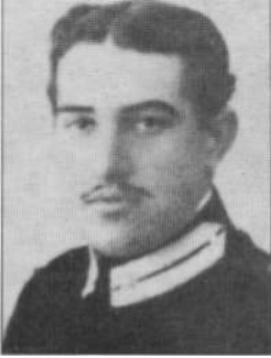
MAIORE Francesco da Noto Aviere Scelto Medaglia d'Oro al V.M. (alla memoria)

«Addetto intrepido specialista di velivolo aerosilurante, esentato dal servizio, per le ferite riportate, chiedeva al proprio comandante in procinto di partire per una nuova missione, la concessione di poterlo ancora seguire e l'onore di far parte ancora una volta dell'equipaggio. Assecondato nel suo desiderio, incurante delle raffiche della caccia avversaria che colpiva gravemente l'apparecchio, impavido e sereno partecipava, in piena comunione di spirito col proprio comandante ad una epica gesta: il lancio dell'apparecchio in fiamme e del siluro contro una nave nemica che veniva colpita e incendiata» Cielo del Mediterraneo, luglio 1942