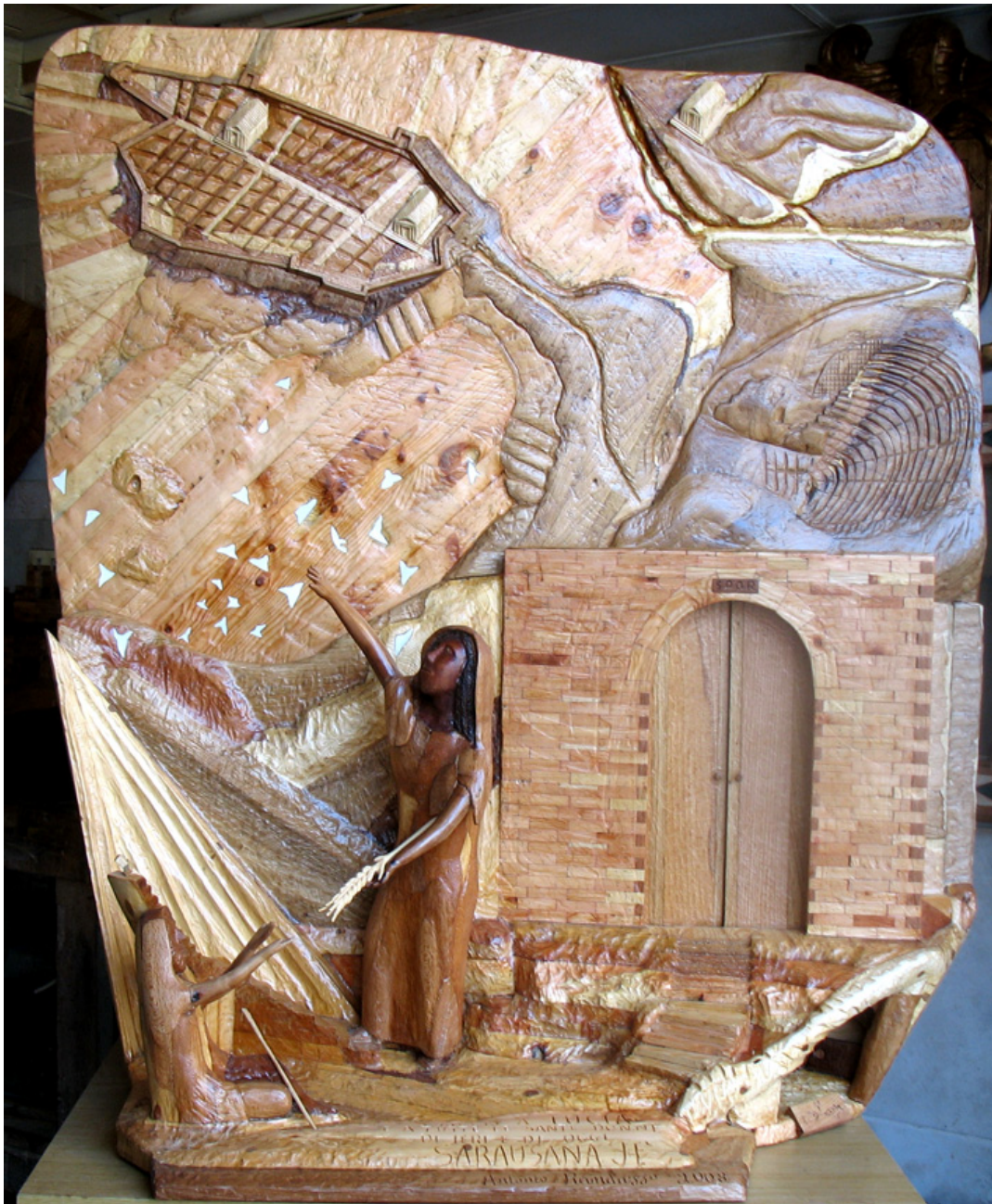
Opera n.123 anno 2008

La scultura è stata catalogata nel mio archivio privato con il n.123 anno 2008.